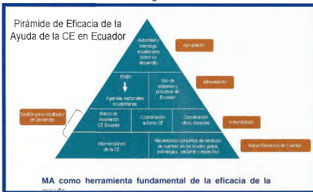
Figura No. 1